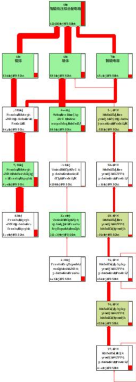
(10) SimPro 9.4.0.1 数据结果不确定度分析

产品↓ 智能低压综合配电箱 重要↓ 物料 方圆集团人力资源管理 集团▷ 黄湘琦 2356481046 智能低压综合配电箱 型号 类别↓ 物料 2356481046 物料 2356481046 方法↓ 核算评价 物料 2356481046 物料 2356481046 洗完提示↓ 是否提示 提示格式↓ 是否提示 排除长期排故↓ 否 截断节点↓ 是